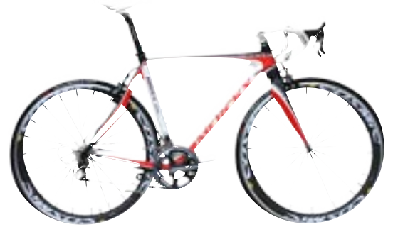
weiß rot schwarz